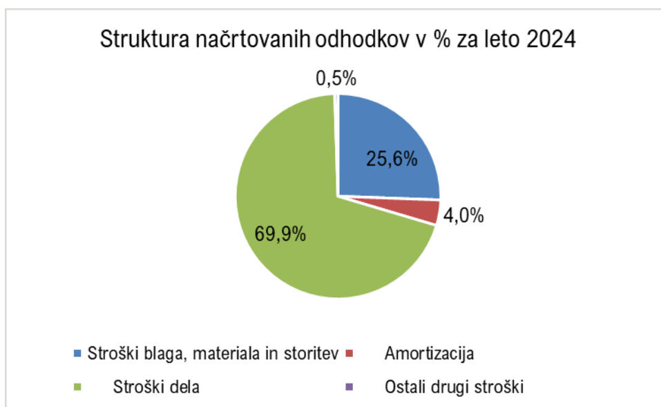
Slika 3: Strukturni delež načrtovanih odhodkov za leto 2024

Strukturni deleži načrtovanih odhodkov za leto 2024 pomenijo delež načrtovanih odhodkov po vrstah glede na celotne načrtovane odhodke v letu 2024. Načrtujemo, da bodo tudi v letu 2024 največji strukturni delež načrtovanih odhodkov predstavljali stroški dela in sicer v deležu 69,9%, sledili jim bodo stroški blaga, materiala in storitev v deležu 25,6%, stroški amortizacije v deležu 4,0 % in ostali drugi stroški, ki predstavljajo zanemarljiv delež v celotnih načrtovanih odhodkih.