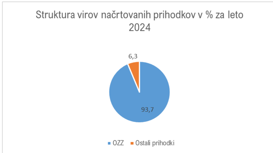
Slika 2: Strukturni delež načrtovanih prihodkov v % za leto 2024

Tako kot v preteklih letih načrtujemo, da bo v letu 2024 prihodek od OZZ še naprej predstavljal največji strukturni delež v primerjavi z načrtovanimi celotnimi prihodki za leto 2024 in sicer 93,7%, ostali prihodki pa skupaj 6,3%.